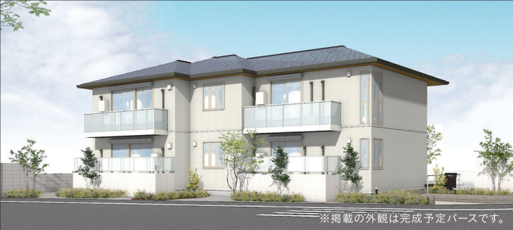
※掲載の外観は完成予定バースです。